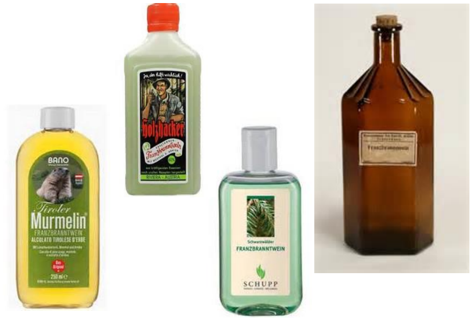
www.bano.at www.medpex.de www.birke-wellness.de www.apothecary-bottles.com